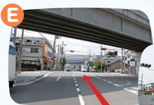
E地点で右折します。