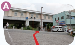
A地点を直進します。