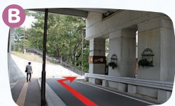
B地点で右折します。