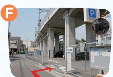
F地点で右折すると東駐車場です。