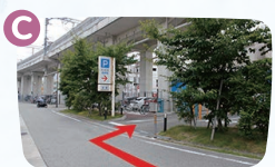
C地点で右折すると西駐車場です。