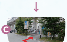
C地点で右折すると西駐車場です。