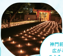
神門前に 広がる ろうそくの 灯り