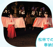
松林での原笙会 奉納舞楽 19:30及び20:30