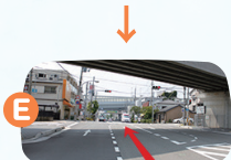
E地点で右折します。

西駐車場が満車の場合、そのまま直進してD地点で右折します。 ※すぐに右折できるポイントがありますが、そこで右折すると一方通行のため東駐車場に入れないのでご注意ください。