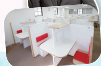
教室責任者 草田 功

T E L 0798-35-7055 H P http://www.kobetsukan.jp/ 定休日 木曜・日曜 営業時間 PM1:00~PM10:00