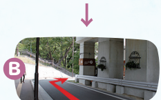
B地点で右折します。