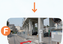
F地点で右折すると東駐車場です。