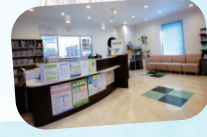
薬剤師 三島 永二郎

T E L 0798-33-1193 定休日 木曜午後・土曜午後・日曜・祝日 営業時間 月 火 水 木 金 土 AM9:00~PM1:30 ○ ○ ○ ○ ○ ○ PM3:00~7:00 ○ ○ ○ × × ×