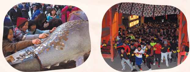
十日えびすの名物の一つとなっている、招福大まぐろ。 毎年恒例の福男が決まる走り参り。