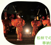
松林での原笙会 奉納舞楽 19:30及び20:30