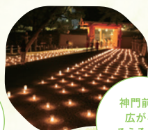
神門前に 広がる ろうそくの 灯り