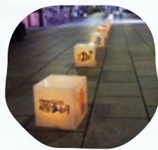
みんなでももそう「まちあかり」