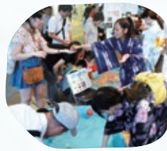
緑日コーナー(有料)

13:00から、阪神西宮駅1Fエビスタスクエア特設会場にてオリジナル行灯づくりをお手伝いしてください。(参加無料)