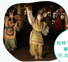
松林での原笙会 奉納舞楽 19:30及び20:30