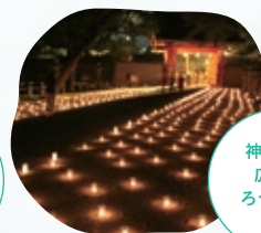
神門前に 広がる ろうそくの 灯り