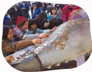
十日えびすの名物の一つとなっている、招福大まぐろ。