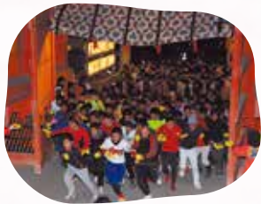
毎年恒例の福男が決まる走り参り。