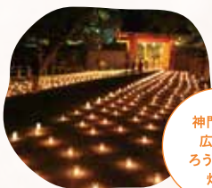
神門前に 広がる ろうそくの 灯り