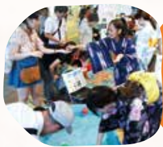
緑日コーナー(有料)

13:00から、阪神西宮駅1Fエビスタスクエア特設会場にてオリジナル行灯づくりをお手伝いしてください。(参加無料)