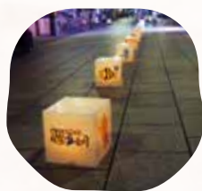
みんなでもそう「まちあかり」