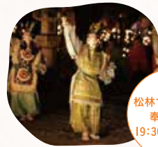
松林での原笙会 奉納舞楽 19:30及び20:30