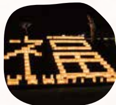
みんなでもそう「福あかり」

ゆかたde福あかり 知って得する・回って得する クイズラリー 当日、ゆかたでご来場いただくと、エビスタ西宮で使える商品券等が抽選で当たるクイズラリーに参加できます!