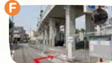
F地点で右折すると東駐車場です。