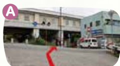
A地点を直進します。