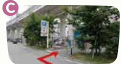
C地点で右折すると西駐車場です。