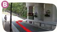
B地点で右折します。