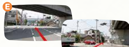
E地点で右折します。