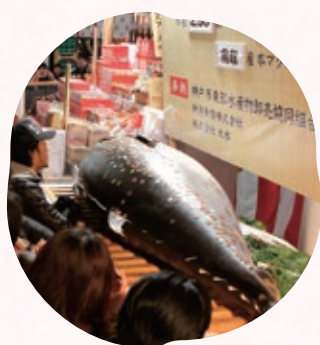
十日えびすの名物の一つとなっている、招福大まぐろ。