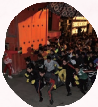
毎年恒例の福男が決まる走り参り。