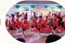
新酒番船パレード