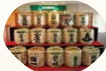
地元酒蔵孤樽(こもだる)展示