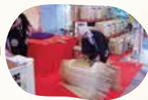
孤樽(こもだる)作り実演