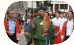
新酒番船パレード

オープニングセレモニーでは、西宮市の友好都市である高知県梶原町の津野山神楽が披露されます。さらには、スペシャルゲストとして浜村淳さんをお迎えし、お集まりいただいた方と一緒に乾杯し、その様子がMBSラジオで生中継されます。また、毎年恒例となっている日本酒の試飲ができる「味わい酒ぐらひろば」はもちろん、バラエティに富んだ食のひろば「日本酒と料理を楽しむひろば」では、料理と一緒に日本酒を楽しんでいただく試みがされています。また、境内では日本酒の文化が感じられる「新酒番船パレード」「新酒番船