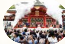
オープニングセレモニー (浜村淳さんを迎え一斉乾杯)

メイン会場 西宮神社 サテライト会場 白鷹緑水苑 / 白鹿酒ミュージアム / 日本盛 酒蔵通り煉瓦館 / 大関 甘辛の関寿庵 エビスタ西宮 / 西宮中央商店街