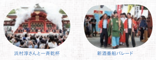
浜村淳さんと一斉乾杯 新酒番船パレード

メイン会場 西宮神社 サテライト会場 白鷹水苑 / 白鹿酒ミュージアム / 日本盛 酒蔵通り煉瓦館 / 大関 甘辛の関寿庵 西宮西宮 / 西宮中央商店街