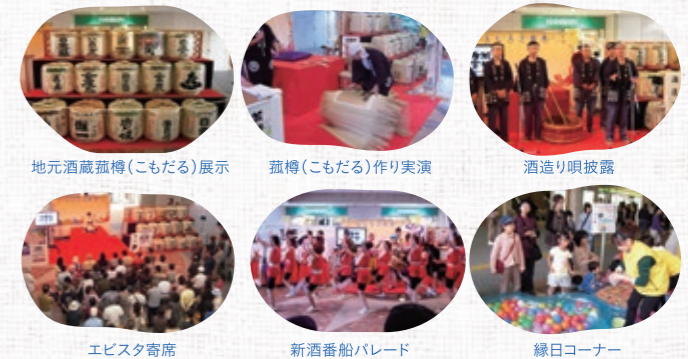
地元酒蔵孤樽(こもだる)展示 孤樽(こもだる)作り実演 酒造り唄披露 エビスタ寄席 新酒番船パレード 縁日コーナー

落語会 『エビスタ寄席』 10月4日(土) 13:30~ 桂 雀太 10月4日(土) 17:00~ 笑福亭 由瓶 10月5日(日) 17:00~ 露 の 都