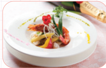
味はもちろん、目にも美味しい料理が楽しめます。