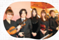
【弦楽アンサンブル】 Luft Musica(ルフトムジカ)