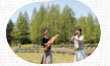
【北欧の伝統音楽】 Lokki(ロッキ)