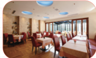
広々とした店内は、パーティにもぴったり!