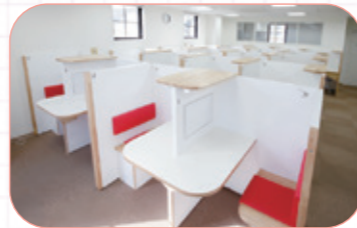
個別式の学習スペースは明るくキレイ!

個別館は小・中・高校生を対象とした一人ひとりに合わせた個別指導で、「学校の成績向上」、「志望校合格」といった目標、さらにその先の夢の実現へのお手伝いをします。高校生は映像授業『研伸館 SAT』との併用も可能です。まずは体験授業をお申し込みください!